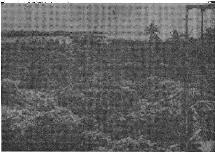
【合众国际社八月十二日传真】档案图片：白宫八月十二日宣布，从一九四六年到一九五八年进行过二十多次核试验的比基尼环状珊瑚岛，人类已经可以重新安全地居住。这两幅档案图片，（左图）为爆炸的后果，比基尼环状珊瑚岛的比基尼岛北端的礁湖湖岸，摄于一九五五年十一月；（上图）为比基尼环状珊瑚岛