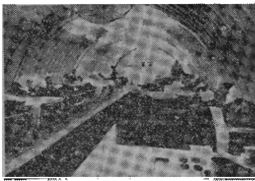
原图说明：可折叠的医院单元，经济轻便